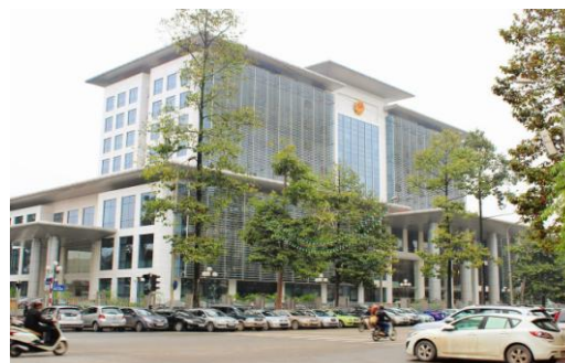
Nhà làm việc Quốc hội (Hà Nội)