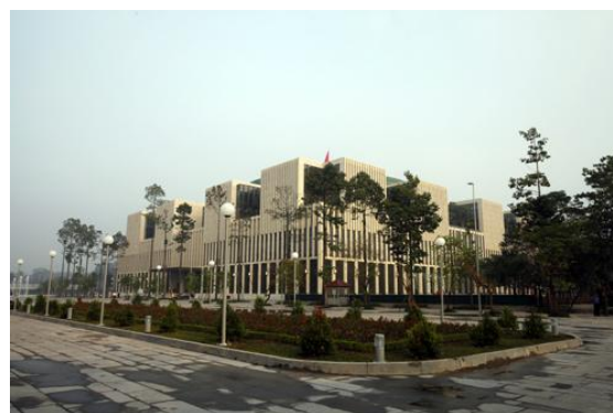
Nhà Quốc hội và Hội trường Ba Đình mới