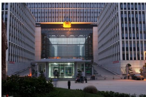
Trụ sở Bộ Công An (Hà Nội)