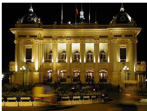
Nhà hát lớn Hà Nội