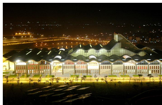
Trung tâm Hội nghị Quốc gia (Hà Nội)