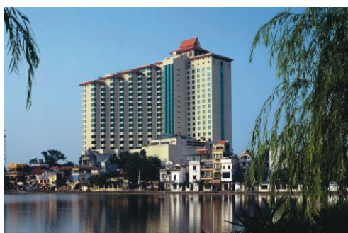
Khách sạn Sofitel Palaza