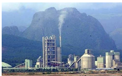
Nhà máy Xi măng Nghi Sơn (Thanh Hóa)